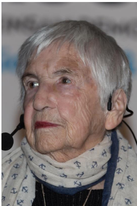
Esther Bejarano 2018